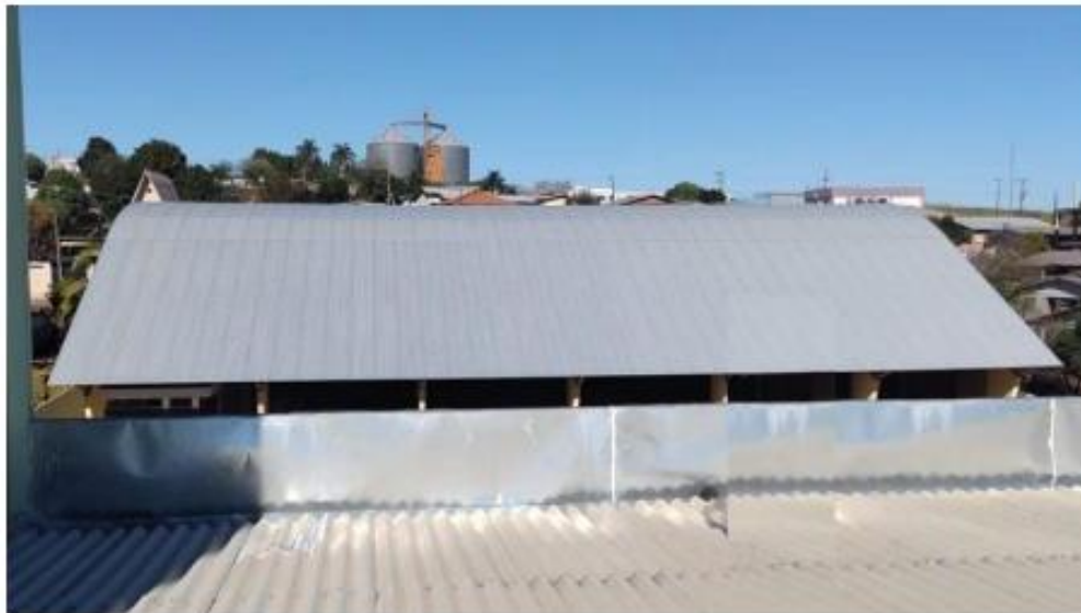
Telhado do Ginásio – Local da instalação

OBS.: Imagem desatualizada, instalação será no ginásio construído.