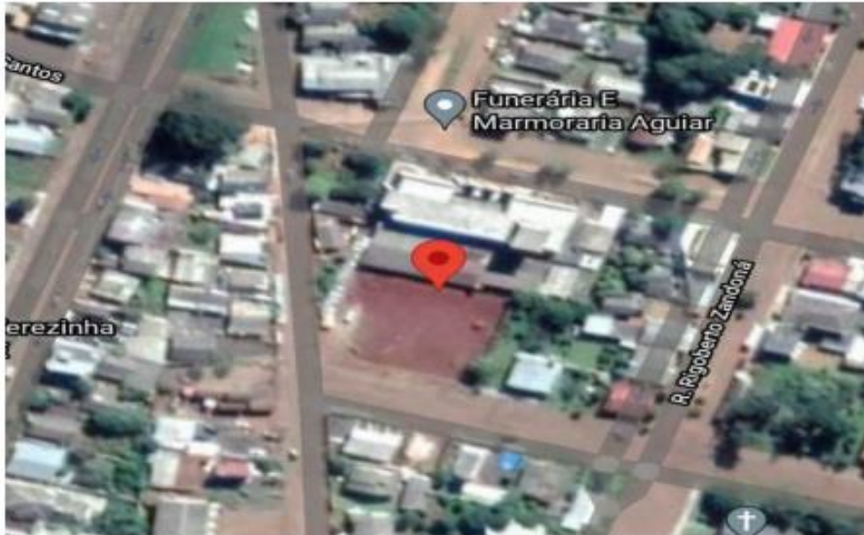
Figura Orientada para o Norte

OBS.: Imagem desatualizada, instalação será no ginásio construído.